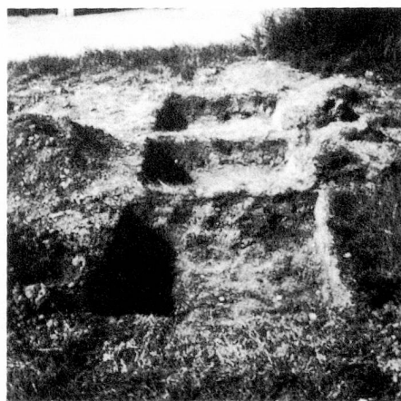
« Une action, le M 2 »