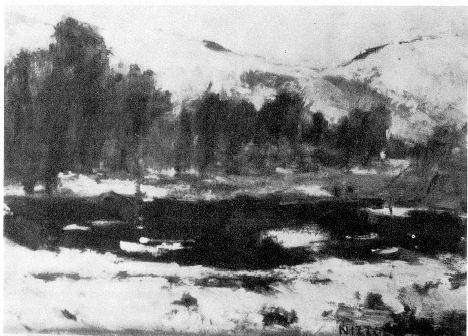
«LA LANCA D'INVERNO»

La Casa Rusca, edificio del tardo seicento che resta una preziosa memoria storica locarnese, è stata d'altra parte scelta quale sede della mostra non solo perché