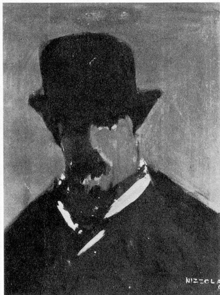
«IL MERCANTE BURBERO»

doverosa verso un artista sovente sulle labbra della gente ma purtroppo ancora malconosciuto, cercherò di puntualizzare schematicamente la «scaletta» operativa e gli obiettivi che ci eravamo prefissati e che abbiamo realizzato. Mi preme comun-