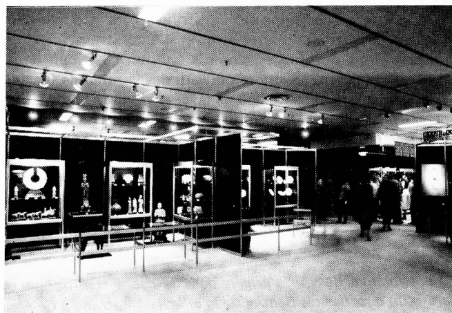
Vue générale de l'exposition à la Placette

D'emblée, il faut remarquer le professionnalisme avec lequel de telles expositions sont réalisées; car c'est un personnel qualifié qu'on engage (parfois à plein temps), spécifiquement pour l'organisation et la mise en place de celles-ci. En outre, de cas en cas, on fait généralement appel aux plus grands spécialistes du thème choisi, conservateurs de musée et historiens de l'art, pour qu'ils sélectionnent les oeuvres, rédigent le catalogue et dirigent l'installation. Les catalogues, souvent luxueux mais sobres, sont de grande qualité, autant par le texte que par les reproductions, et sont tirés à des milliers d'exemplaires. Une attention toute nipponne est portée à la présentation des oeuvres, ambiance du lieu, couleurs, éclairage, "respiration" des objets ou des tableaux. On n'hésite pas, par exemple, à fabriquer des meubles et des présentoirs sur mesure, comme ce fut le cas dans chacun des trois magasins de la chaîne Mitsukoshi