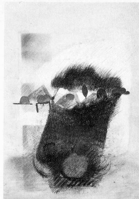
Landschaft, Gouache und Farbstift, 1979