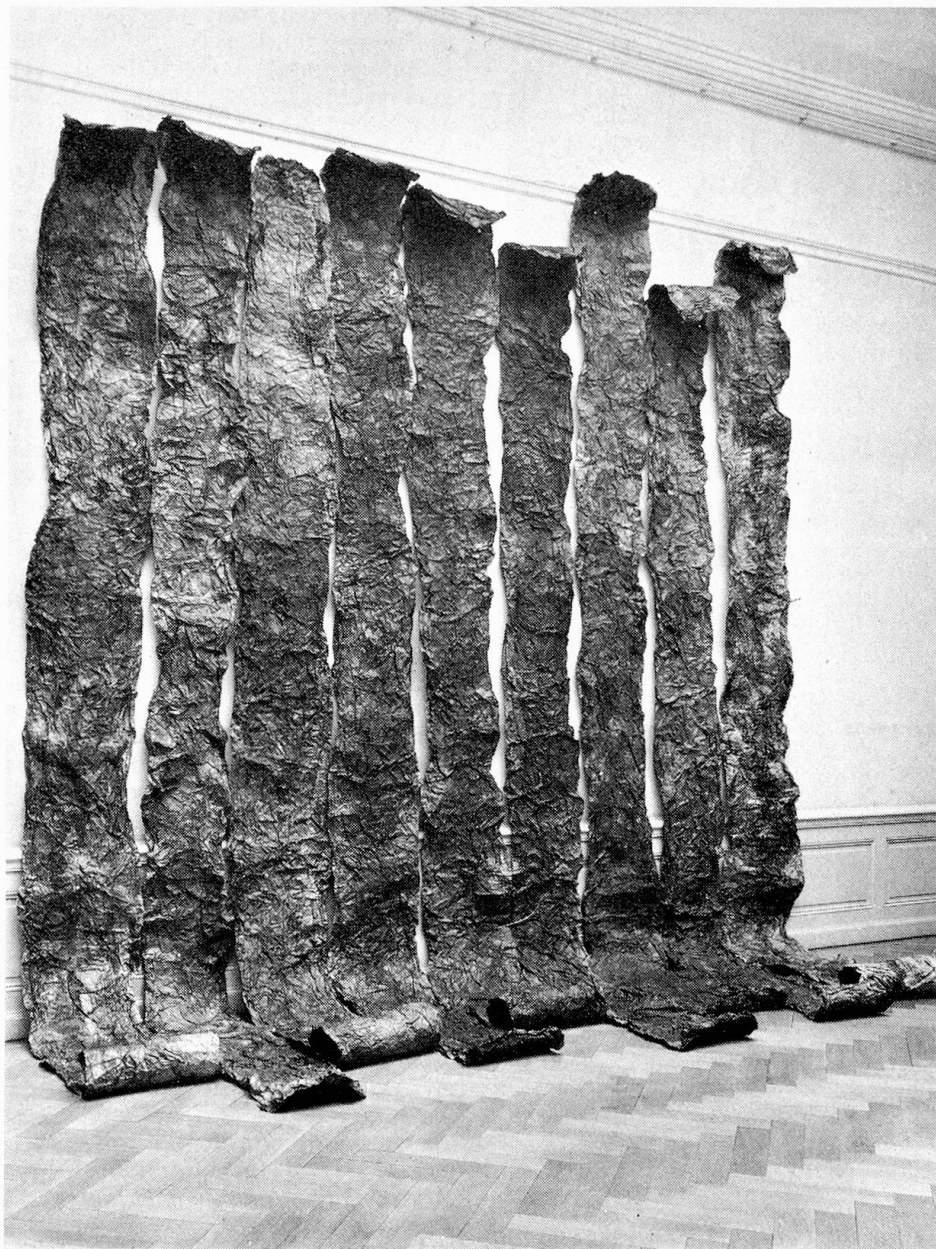
Papierbänder, gefärbtes Papier, 1972

Ab 1978 Spinnengewebegegenstände. Zahlreiche öffentliche und private Preise und Stipendien. Viele Einzel- und Gruppenausstellungen im In- und Ausland. Musikalische Aktionen (ab 1977) mit dem Scharlatan Sextett.