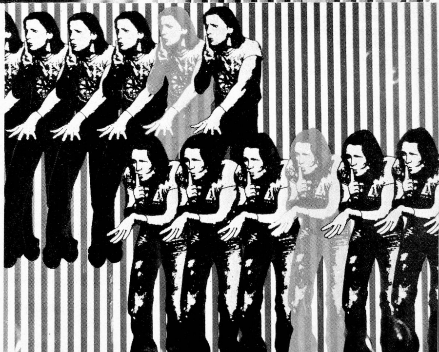
Fotogramme aus dem Experimental Trick-Film «Pssstt...», 1979, basierend auf Zeichnungen