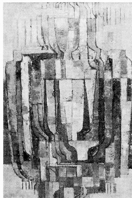
Komposition, Fuge, 1974