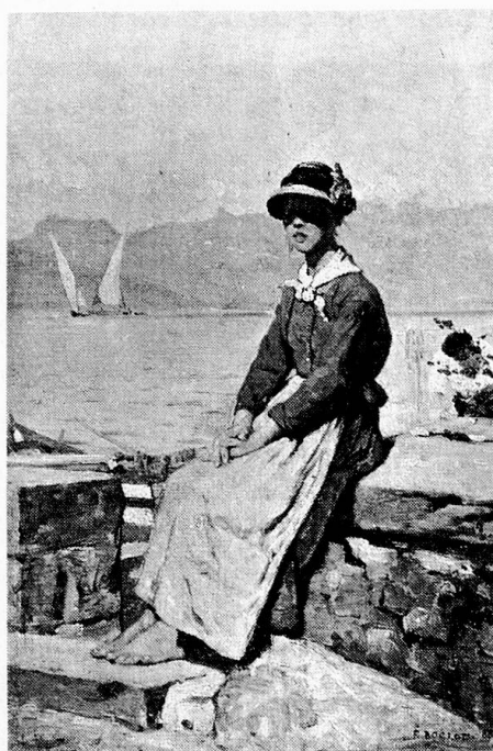
François Bocion: Jeune fille de Tourronde, 1886

système d'idéalisation. Cependant, ce travail d'atelier, qui permet l'emploi des recettes les plus savantes, avait pour base – chez Bocion du moins – des esquisses, des pochades, des études directement exécutées sur le motif, en toute liberté.