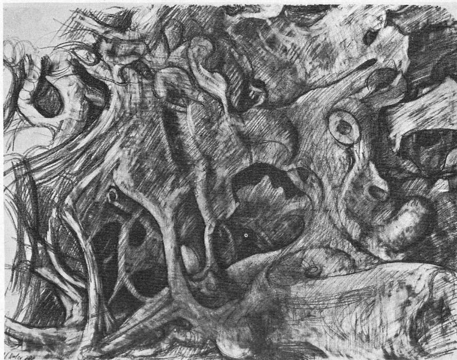
Höhlenlabyrinth, Zeichnung, 1978