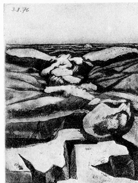
Serie von Radierungen, 1976