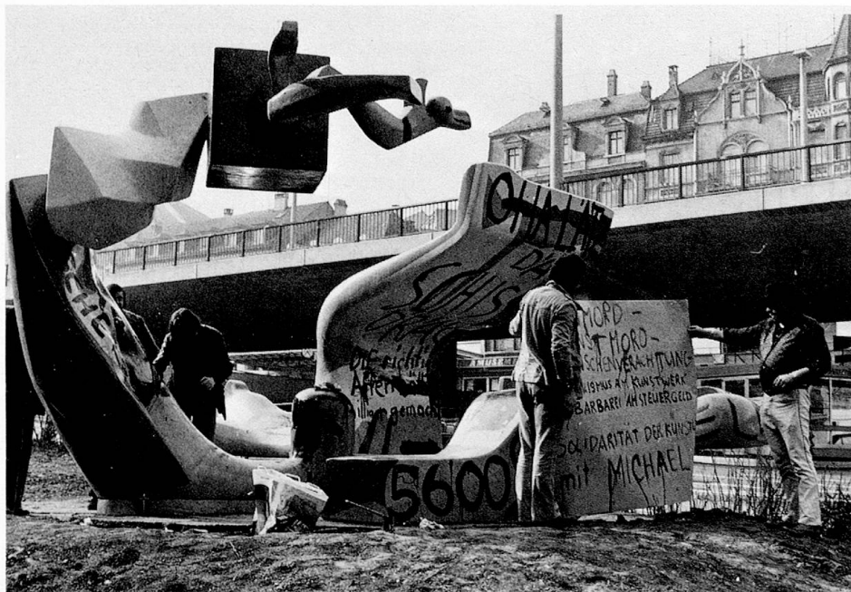
Plastik von Michael Grossert: Nach der Tat

In der Entwicklung des Graphikers gibt sich um 1966 eine Zäsur. 1960–1966 zeigen die Blätter noch häufig malerische und atmosphärische Effekte, die Linien können zum Gekräusel werden, sich zur Punktreihe auflösen oder sich zur differenzierten Fläche verdichten. Auf einigen Blättern – etwa den Punch-Lithographien – ballt sich chaotisches zu explosiver Kraft. Nach 1966 wird der Ausdruck strenger, bestimmter, geordneter. Trotz der augenfälligen Absicht, keine Linie zuviel zu setzen, wachsen die Blätter im Lauf der Arbeit zu immer