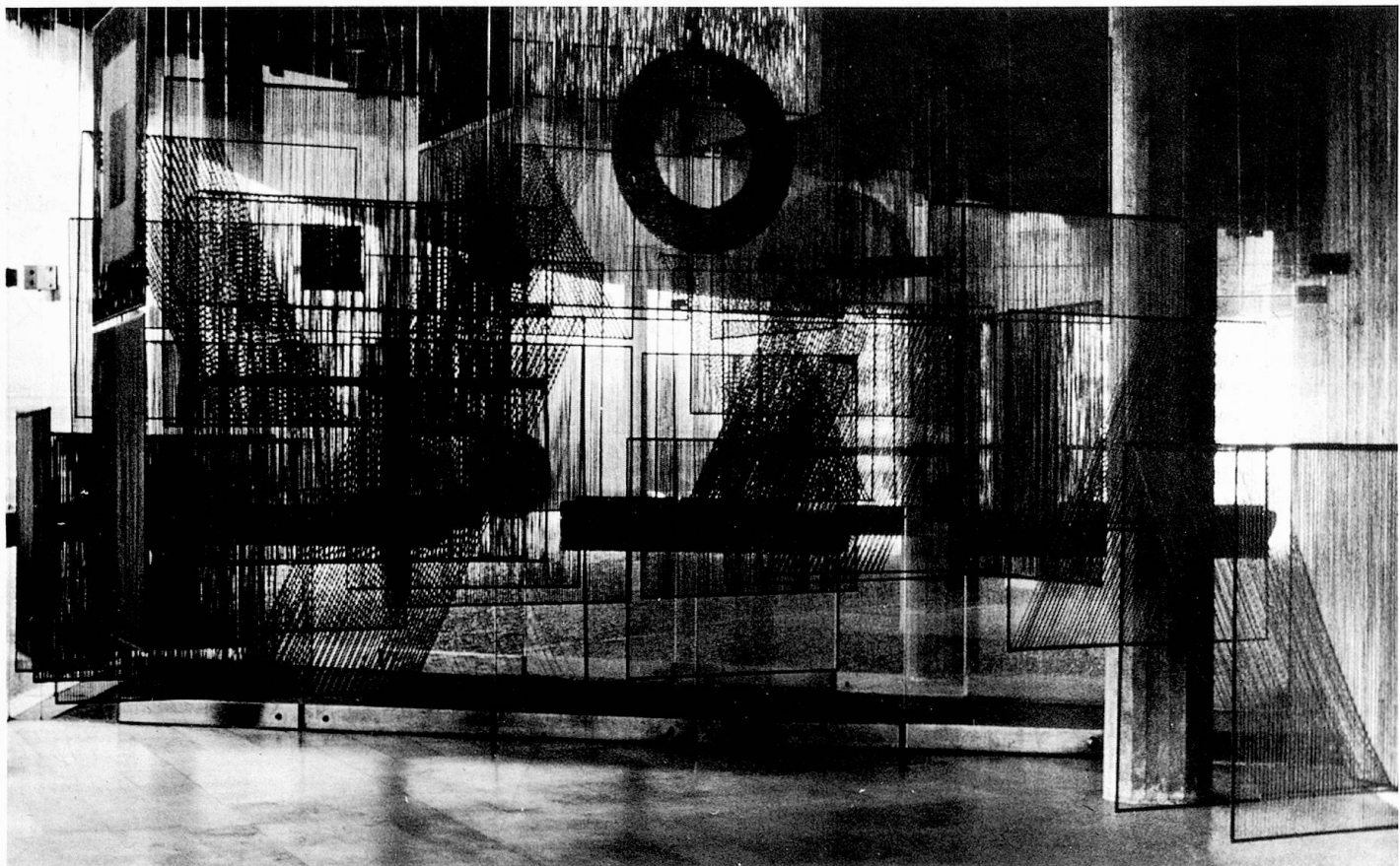
Elément spacial I, 1970