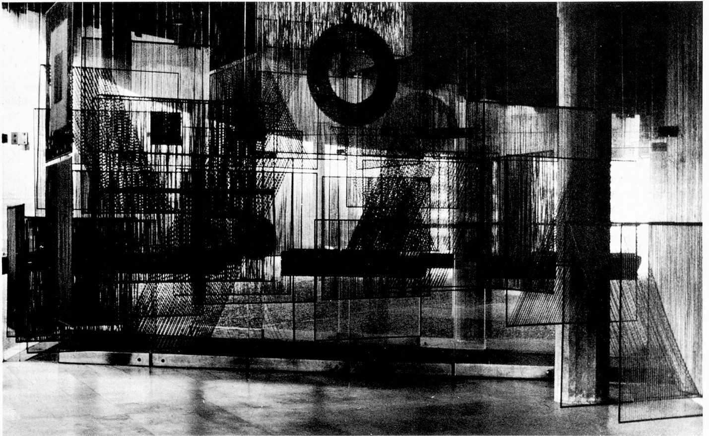
Elément spacial I, 1970