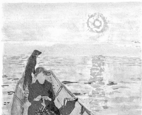
Karl Landolt «Abends im Boot»