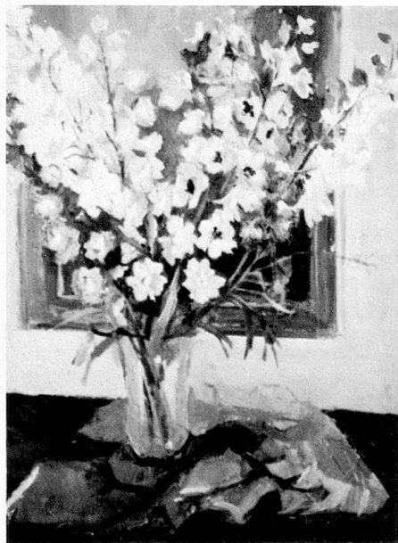
Pieds d'alouette, 1970

Certains de ses amis ont dit de lui qu'il était «le peintre de la Réalité poétique» ou mieux encore «le témoin de son temps». Je pense que nous sommes tous les reporters de notre temps, nous qui fixons l'image.