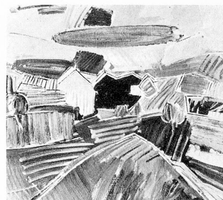
Landschaft mit rotem Fleck, 1965

Werner Schaad Museum zu Allerheiligen Schaffhausen 12. Jan. bis 23. Febr. 1975