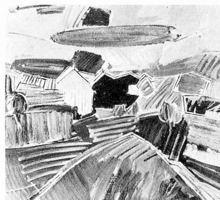
Landschaft mit rotem Fleck, 1965