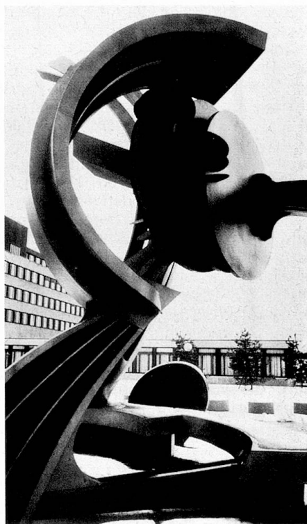
Stahlplastik 1973/74, Detail

So beginnt die von Fritz Billeter im ABC-Verlag herausgegebene Monographie über Mattioli, die seit Oktober 1975 zu Fr. 78.- im Buchhandel erhältlich ist. Mit solchen Sätzen taucht Billeter direkt ein in Herkunft,