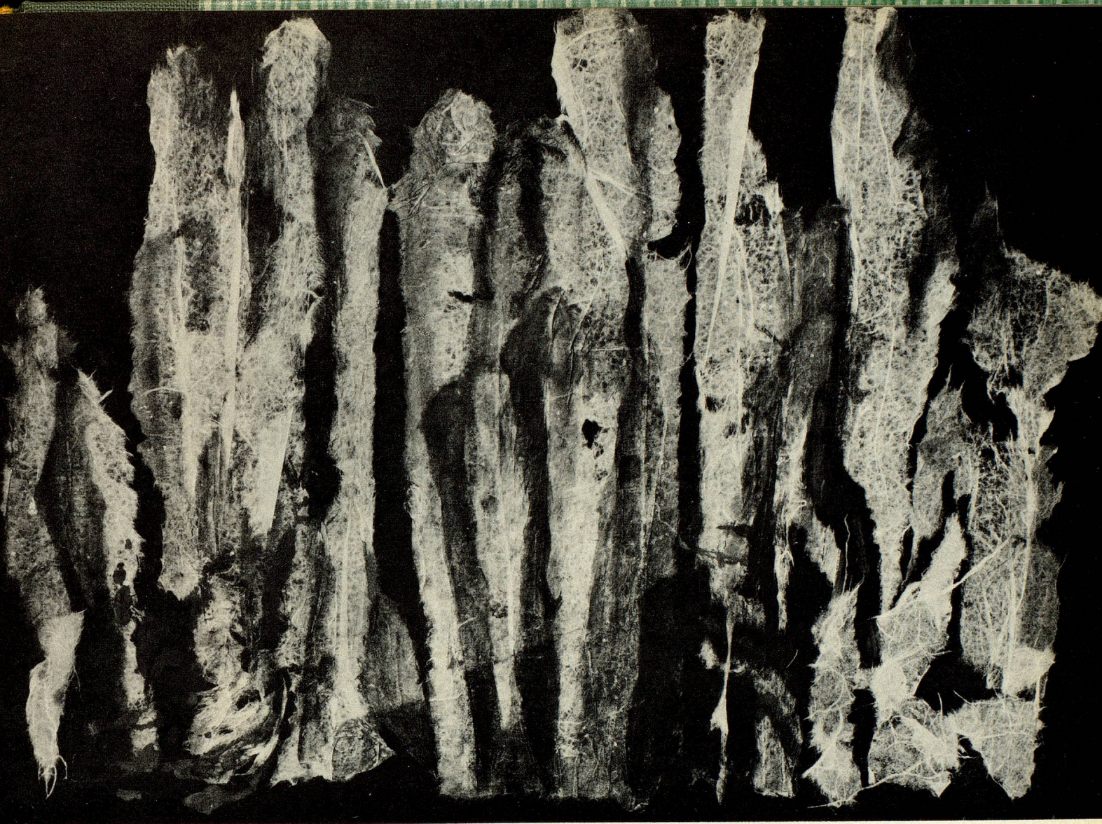
Louba Buenzod, peintre, Lausanne «Végétaux», collage, 70 × 100 cm, 1965