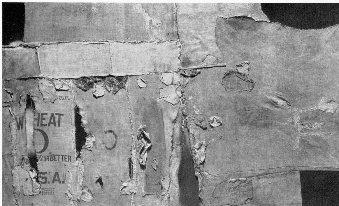
Alberto Burri: «Wheat Heat», 1956 Sammlung Dotremont, Kunsthalle Basel

endete Ausstellung der Sammlung Dotremont. Sie durfte zu den ganz guten Ausstellungen moderner Kunst gezählt werden, die vom Kunstverein Basel veranstaltet wurden.