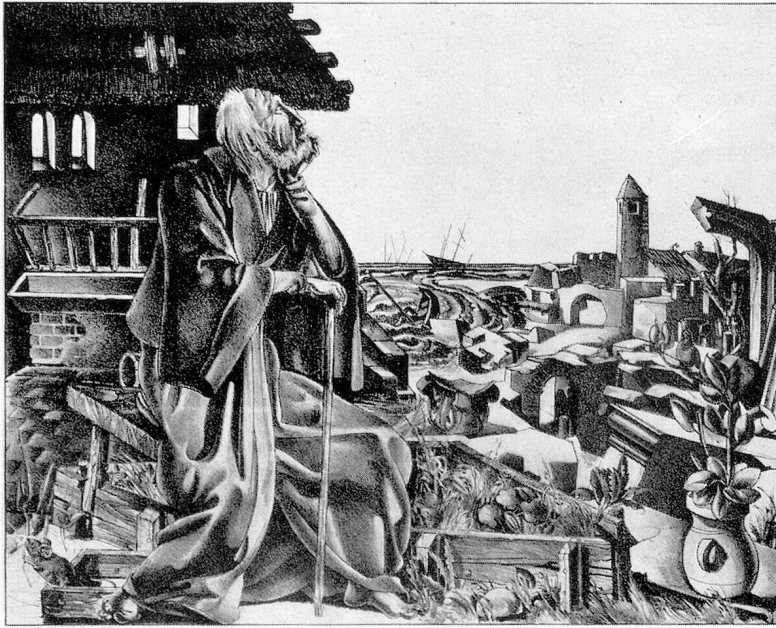
Ernst Georg Rüegg 1919