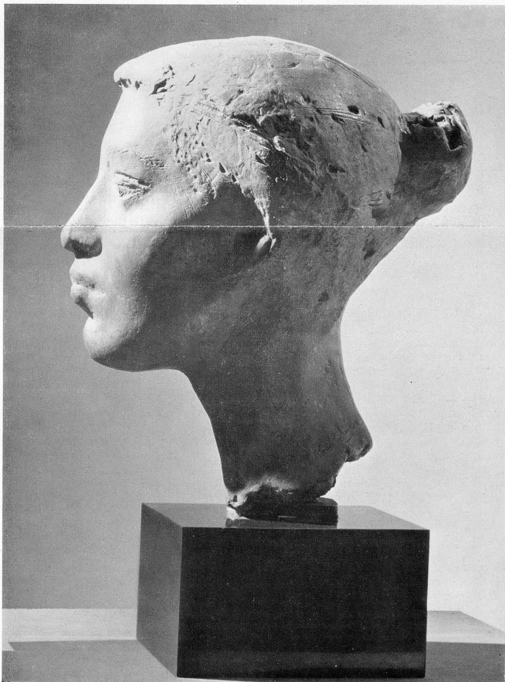
Max Weber: Tête d'Egyptienne