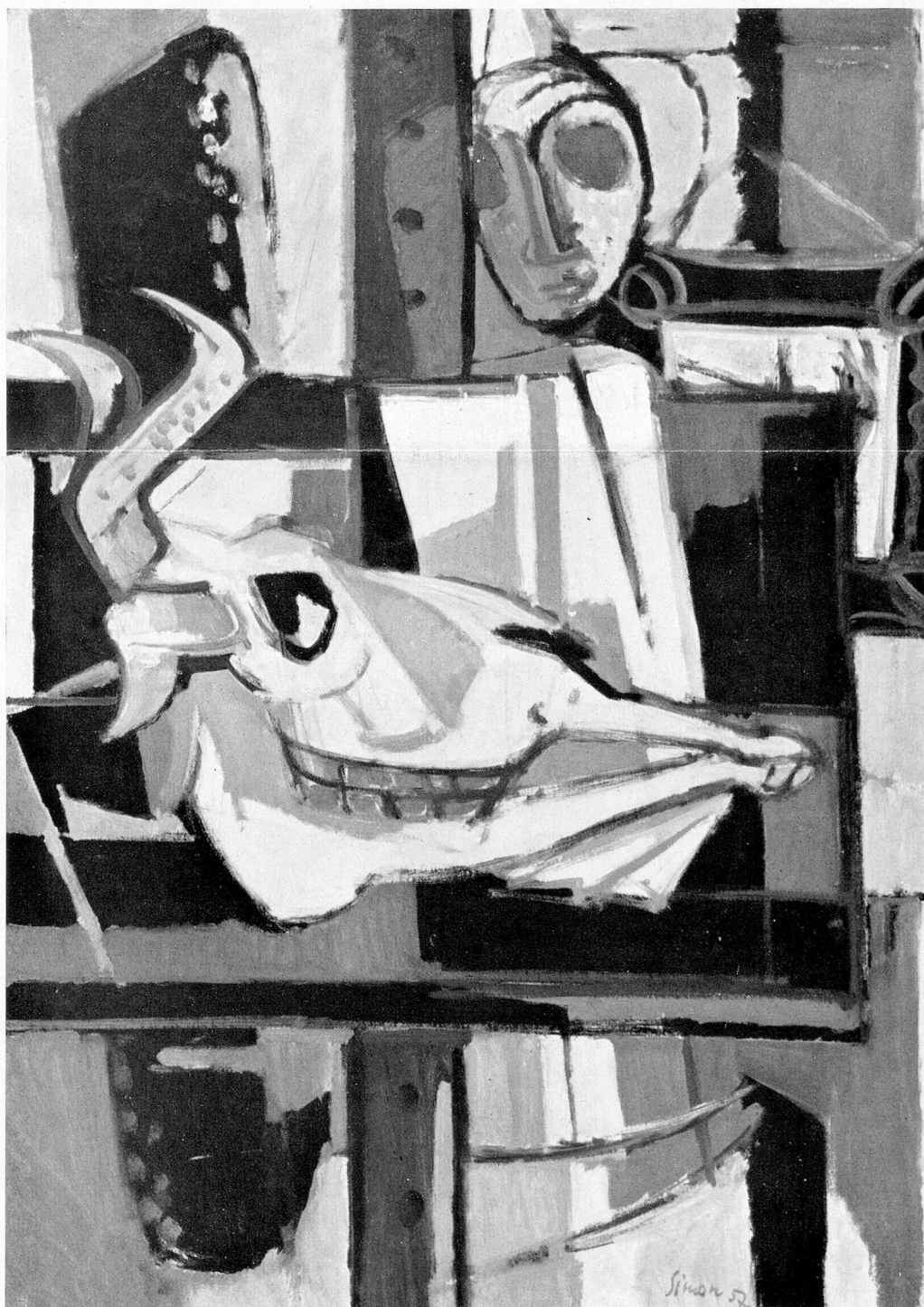
Walter Simon: Stilleben

Que les Autorités vaudoises et M. Manganel trouvent encore ici notre gratitude d'avoir bien voulu nous accueillir dans le Musée cantonal des beaux-arts pour cette importante XXVe exposition de la société des PSA. Jean Latour