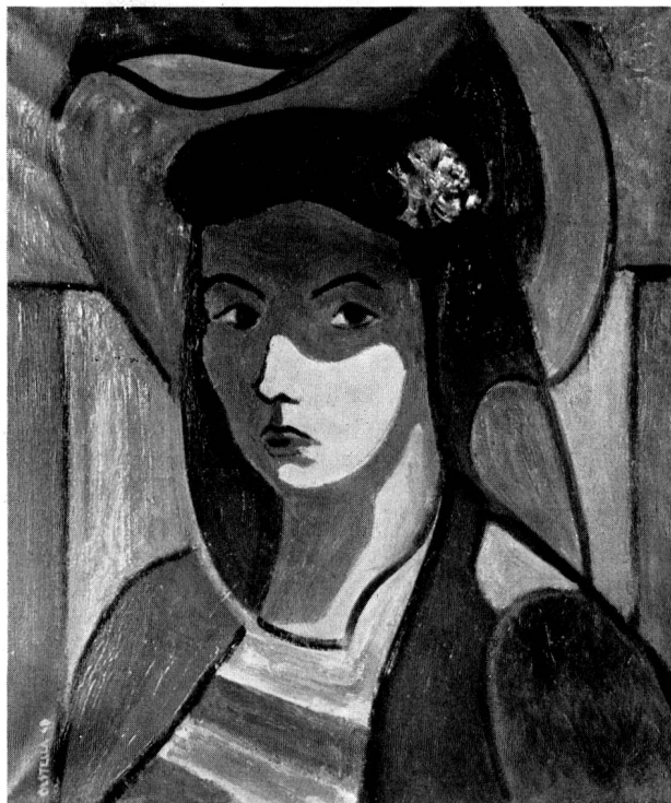
Pascal Castella, «Madeleine» 1949

der neuen Kaserne Freiburg bewiesen, daß er die Anforderungen des Wandbildes beherrscht.