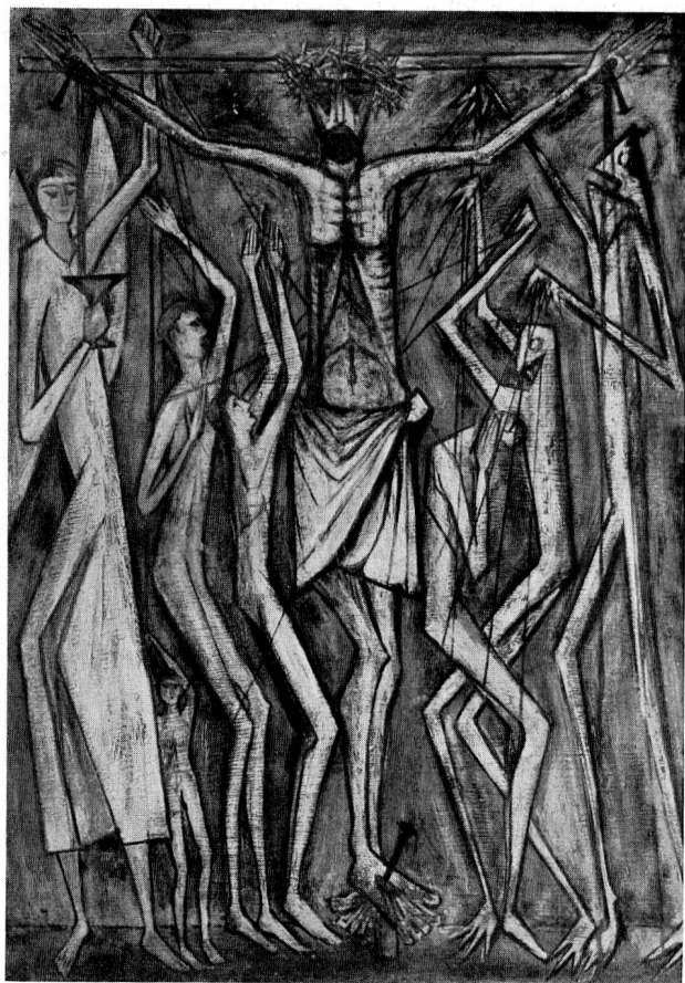
Armand Niquille, Allégorie

Auch in unserem jüngsten Künstlernachwuchs melden sich Talente, die Verheißungsvolles in Aussicht stellen. Erwähnt seien u. a. Aebischer-Yoki , der sich bereits verschiedentlich im Ausland in kirchlichen Freskomalereien und Glasgemälden mit Erfolg betätigt hat. P. Castella tastet sich in seinen unkonventionellen, farbig breit angelegten Gemälden immer mehr zur Behauptung einer eigenen Sehweise durch. — B. Schorderet hat kürzlich in der Ausschmückung