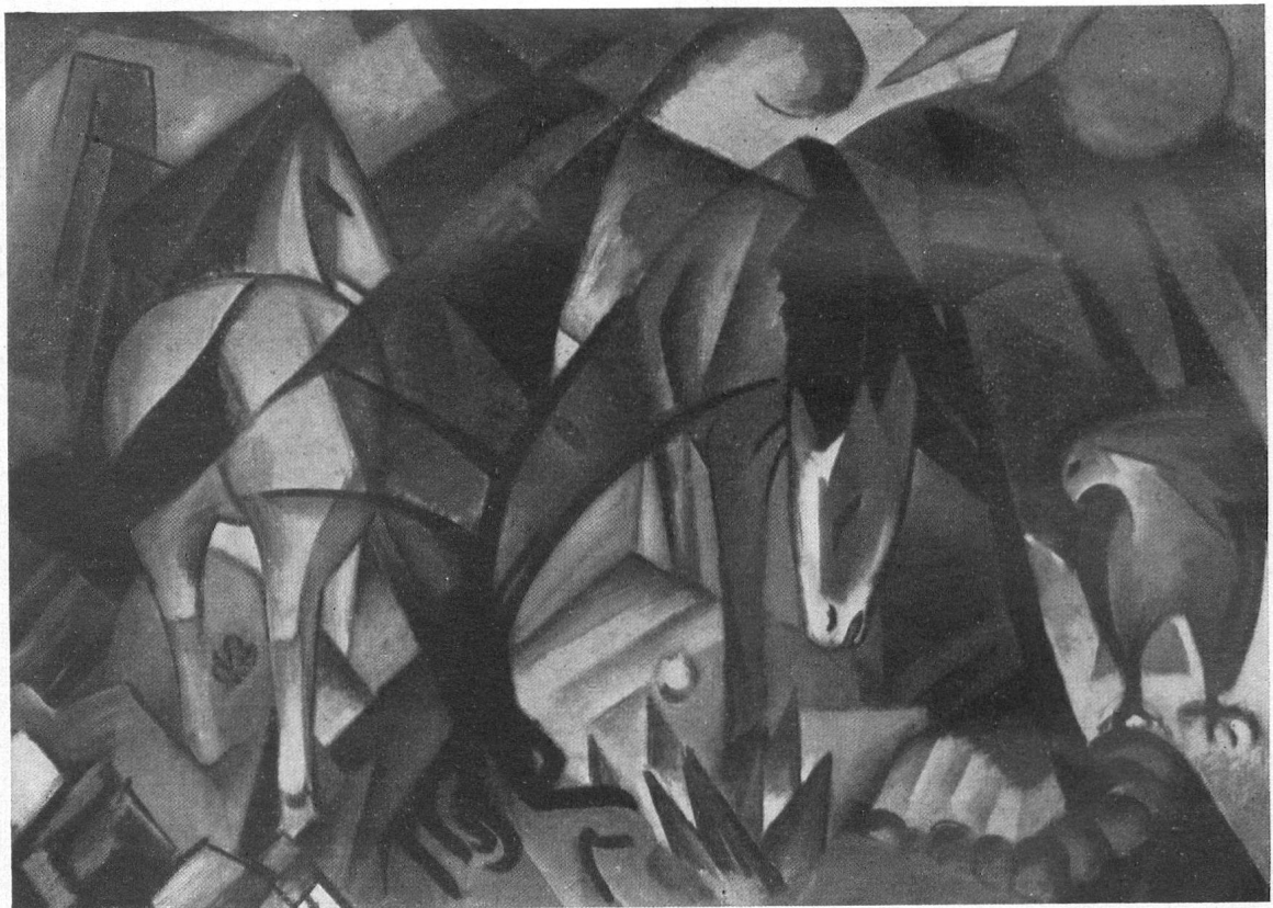
Franz Marc Pferde und Adler

L., ich schrieb Dir schon eben eine Karte von hier; ich hab mir als Weihnachtsgeschenk einen Tag Urlaub genommen um das geliebte Münster wiederzusehen, das mich vor einem Jahr so tief erregte. Der Ausflug ist recht nett gelungen; ich fuhr gestern Abend mit einem Wägelchen von Leiningen nach Bensdorf, stieg dort in den Schnellzug und war 8.40 in Straßburg. Schon die Mondscheinfahrt im Wagen war reizvoll und träumerisch, — erst recht dann der Nachtbummel durch Straßburg. Es ist etwas ganz besonderes, unter diesen Umständen plötzlich in eine Großstadt versetzt zu werden; (— München wirkt nicht so unmittelbar auf mich, da ich es zu sehr kenne, persönliche Interessen habe, nicht allein bin usw.); die ganze, im Grunde abscheuliche Seltsamkeit unsrer Zeit spricht aus einer solchen Stadt; die gegenwärtige Kriegssituation wirkt auf alles noch ein besonderes Schlaglicht. Ein Kaffeehaus mit seinen Kartenspielern, Geschäftstypen, armen Kellnerinnen wirkt ganz infernoartig; das Straßenleben wirkt auch merkwürdig unterirdisch, unwahrscheinlich, als wäre es längst vergangen, nur mehr im Bilde da. All die sonderbaren Leidenschaften auf den Gesichtern. Ich sah plötzlich ein Vögelchen auf einem Gesims sitzen und hatte das Gefühl, als wäre dies Vögelchen, das einzig Lebendige, unbefangen Wirkliche in einer toten Stadt, in der nur mehr Leichen gehen. Ich verstehe Kubin's Perle so gut! Er hat dies alles glänzend gesehen. Es machte