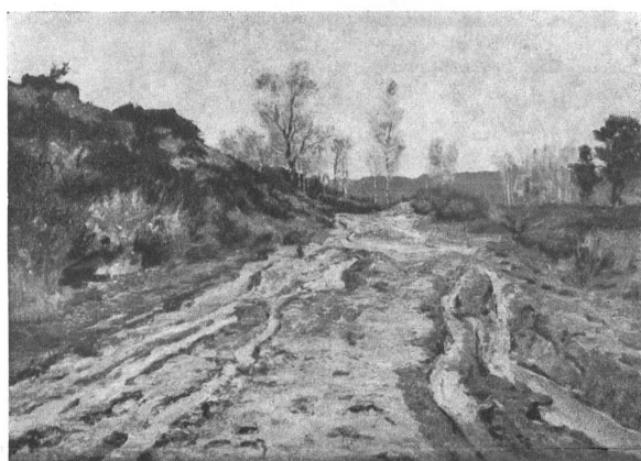
Charles-Édouard DuBois, Chemin de Vaux de Cernay