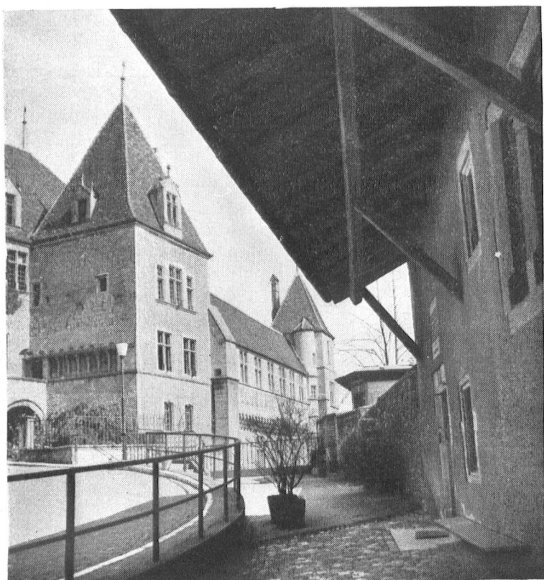
Neuchâtel, Le Château