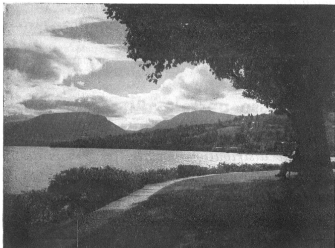
Neuchâtel: Quai Osterwald et Trou de Bourgogne