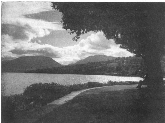
Neuchâtel: Quai Osterwald et Trou de Bourgogne