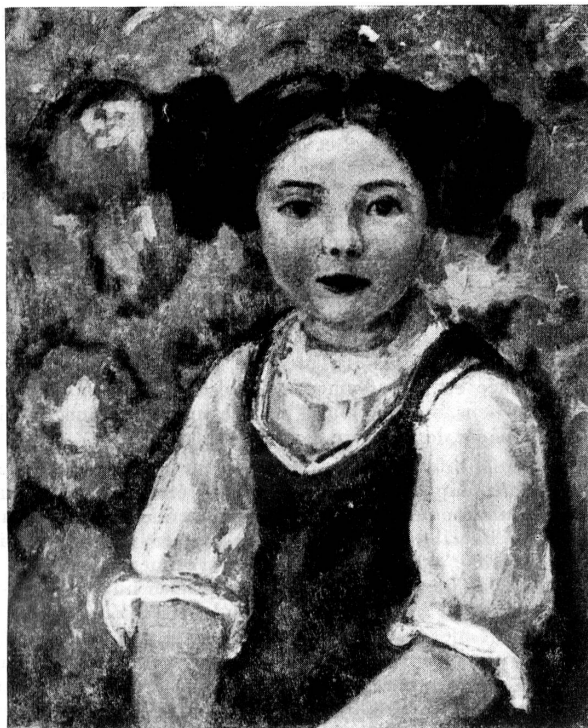
Louis de Meuron.