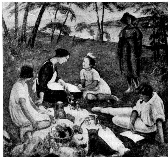
Louis de Meuron.

Voyez, près de sa demeure, parmi le velours des gazons, les pommiers détacher la courbe de leurs branches sur l'écran mauve de la montagne, sur l'émail bleuté du ciel; voyez la grève proche, où le treillis délicat des bouleaux et des saules laisse entrevoir, fuyant vers un calme horizon, la nappe changeante du lac. Ou encore, pénétrant dans le plus accueillant, le plus libéralement ouvert des ateliers, voyez les êtres humains qui y circulent — beaucoup d'enfants, parmi eux —, voyez ce bouquet sur la cheminée, ces fruits sur la table. C'est de ces choses simples et journalières, longuement vécues par une âme égale, que l'art de Meuron se nourrit. De fait, sous le nom de portraits, de paysages, de natures mortes, il ne peint rien d'autre que cet Univers, ce grand Tout, qui peut tenir dans dix mètres cubes d'espace et que forme le trésor, lentement accumulé, perpétuellement accru, des sensations et des émotions. Fleurs, visages, ciels, autant de symboles, de signes interchangeables, par quoi l'artiste édifie au-dessus de la réalité matérielle le monde tout spirituel de la peinture.