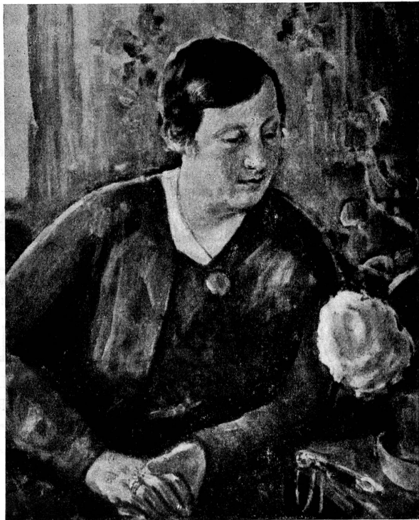
Louis de Meuron.