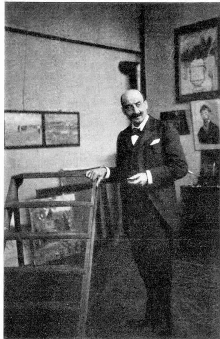
M. Liebermann in seinem Atelier, 1904.

Mir war es schrecklich, lange an einer Sache zu malen, ich konnte, wenn ich die Leinwand voll hatte und meiner Meinung nach alles am rechten Platz war nur noch daran herumkursen, vorsichtig, um nichts zu verderben.