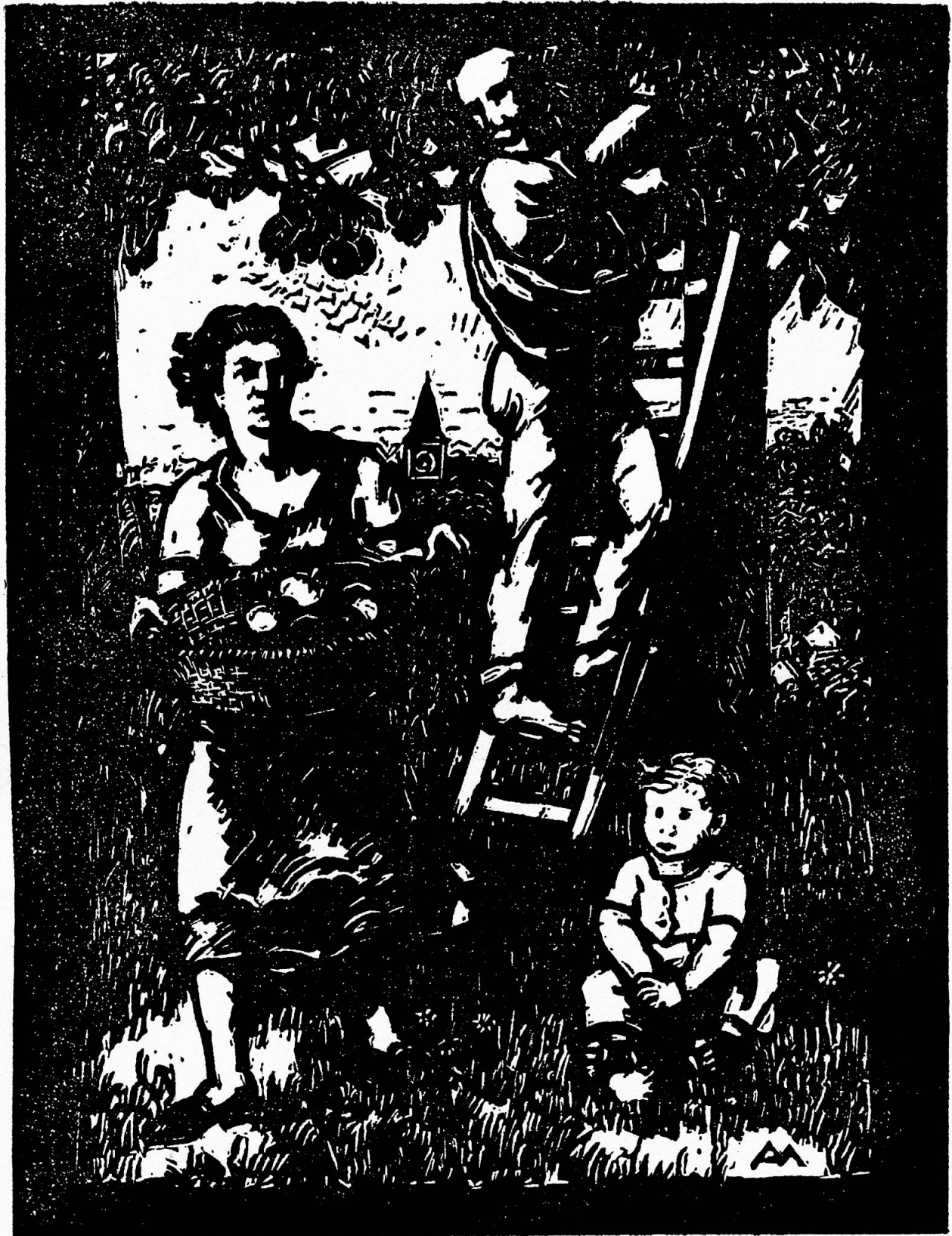
ERNTE, NACH EINEM HOLZSCHNITT VON A. MARXER, KILCHBERG (ZÜRICH)