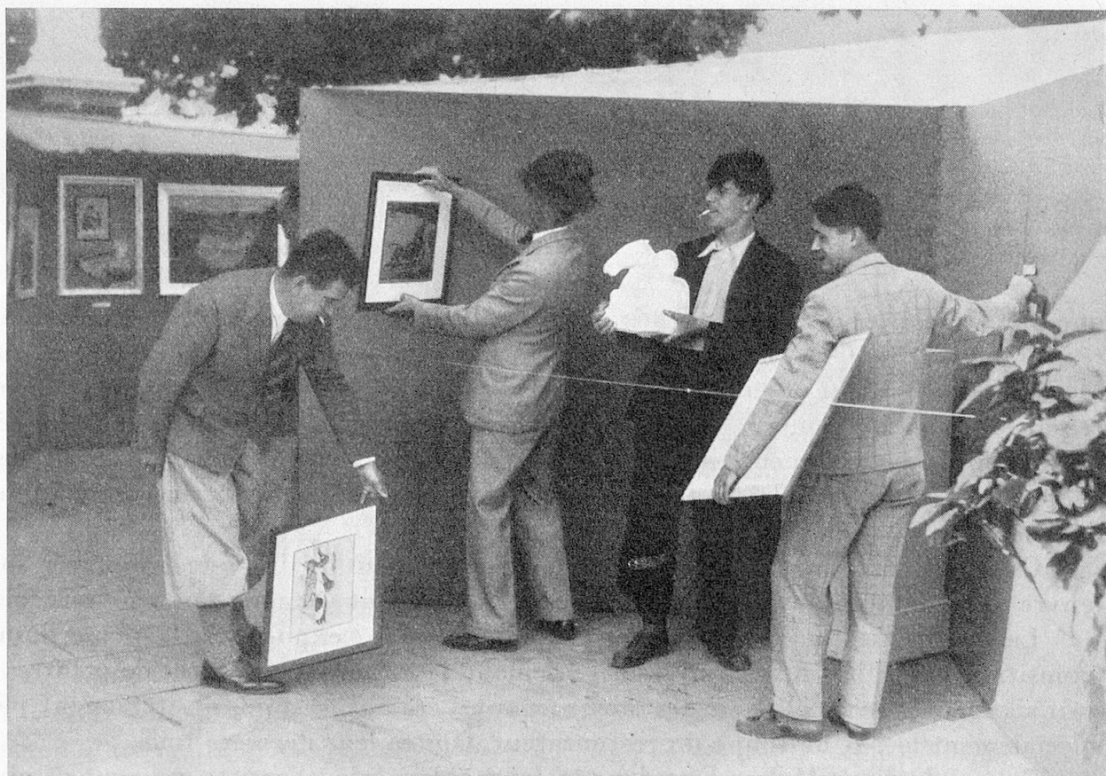
Phot. F. H. Jullien, Genève.