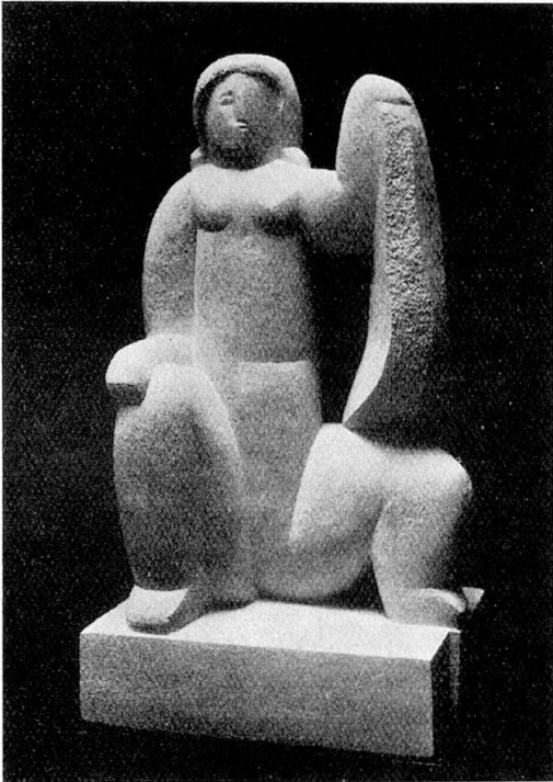
Laurens, Paris Sitzende Frau, Stein Femme assise, pierre