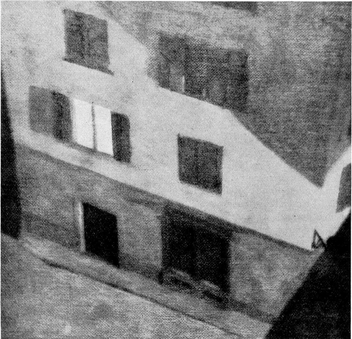
Haus von oben