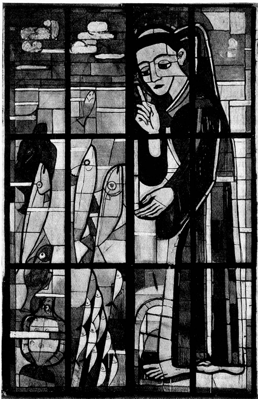
Fischpredigt des hl. Antonius, Entwurf für Glasfenster

Die zweite Urfunktion, die Fuß an Fuß mit dem Schöpfertrieb des Menschen schicksalbestimmend in seinem Leben mitwirkt, die Zuchtwahl und der durch sie bedingte Schönheitstrieb –