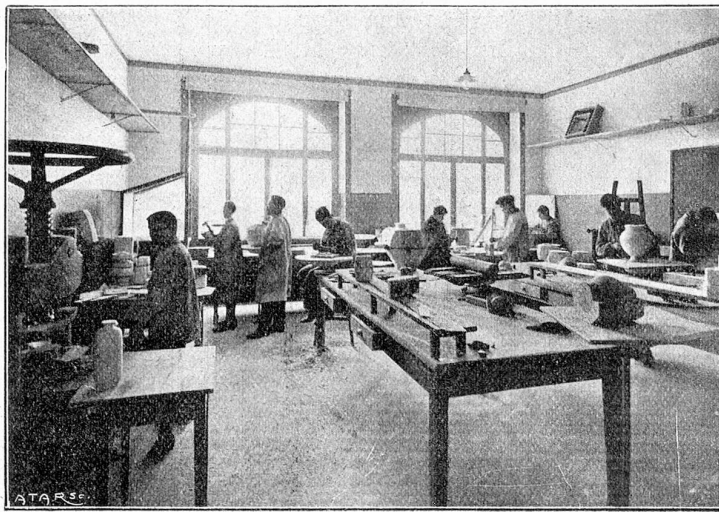
ÉCOLE DE CÉRAMIQUE. ATELIER AVEC PRESSE.

Ich komme nun zu dem Punkt der Erwiderung des Widmannkomites, in welchem es mich der Entstellung