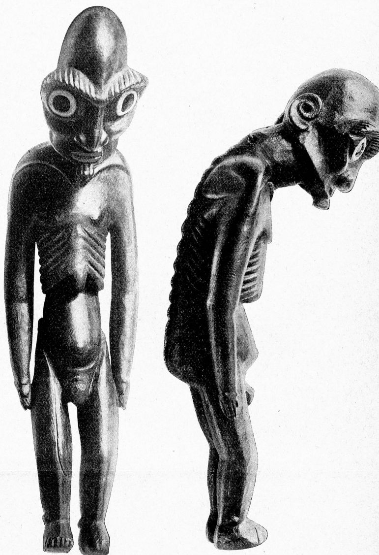
Statuette de l'Île de Pâques.