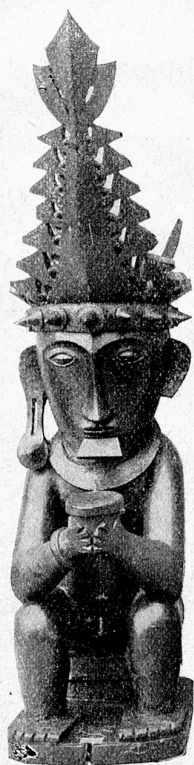
Statuette battak (Sumatra).

Peintre de l'Italie, peintre de la Grèce et de l'Égypte, il aimait à répandre sur la toile la chaude couleur du soleil d'Orient : les paysages du Nil, les rivages de la Méditerranée sont représentés sur