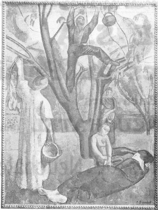
Alex. Blanchet. — Le cerisier .