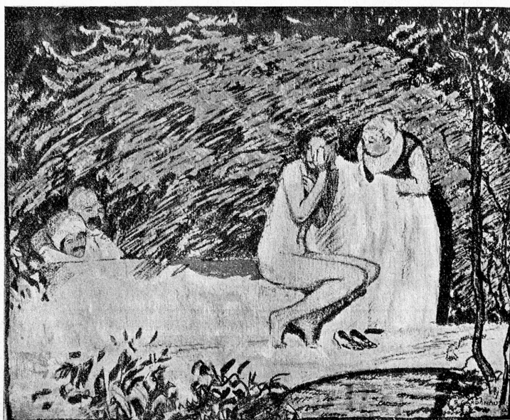
Unser Kunstblatt 1912 von E. Cardinaux, Bern.

Les carreaux des fenêtres ne sont pas en