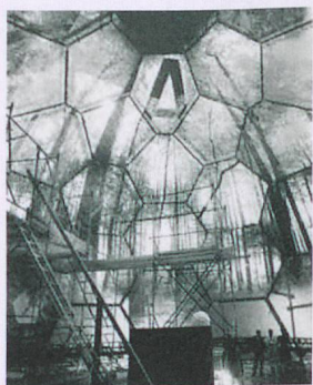
Die SVZ präsentiert an der Landesausstellung in Lausanne eine Polyvision-Panoramashow (spezielles Breitbildformat) in einem spektakulären Pavillon.

Die Bewahrung der Natur ist ein Kernanliegen von Schweiz Tourismus – und damit definitiv ein strategischer Erfolgsfaktor. Der neue Slogan seit 2003 «Die Schweiz. ganz natürlich.» bringt es auf den Punkt: 18 neue Naturpärke und eine Charta für die Nachhaltigkeit zusammen mit Branchenpartnern (2009) sprechen Bände. Nur folgerichtig, dass sich das Motto für das Jubiläumsjahr 2017 auf die Wurzeln besinnt: «Die Natur will dich zurück» – den Reisegrund für die (Wieder-)Entdeckung der Schweiz schlechthin.