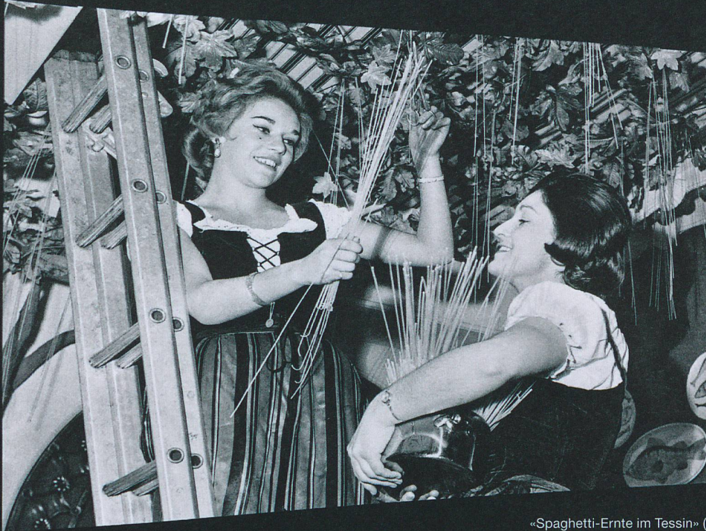
«Spaghetti-Ernte im Tessin» (1957), gedreht von der BBC mit Unterstützung der SVZ in London.