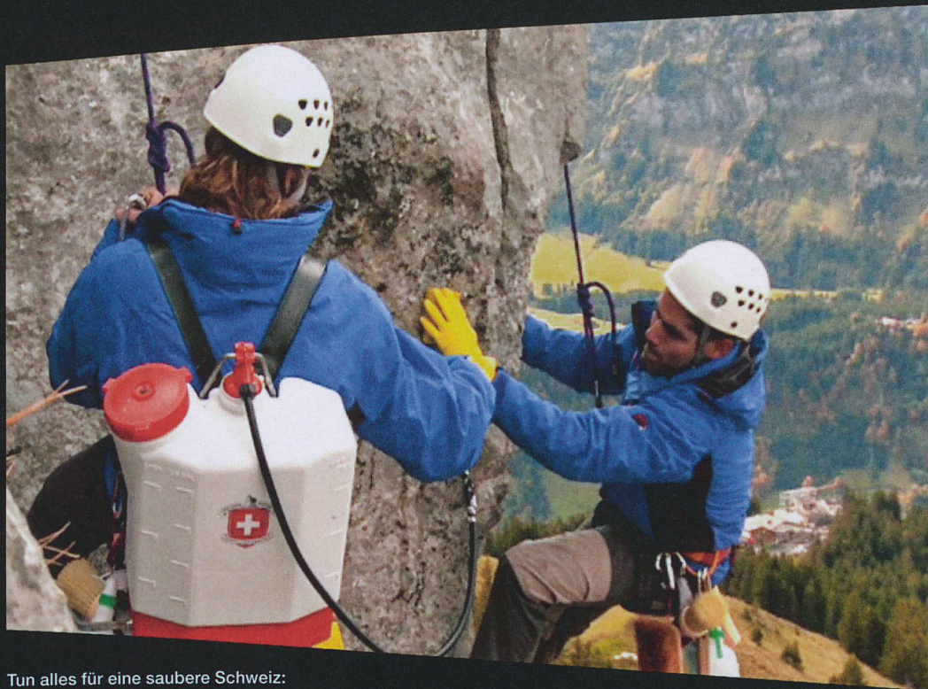
Tun alles für eine saubere Schweiz: die Felsenputzer zum 1. April 2009.