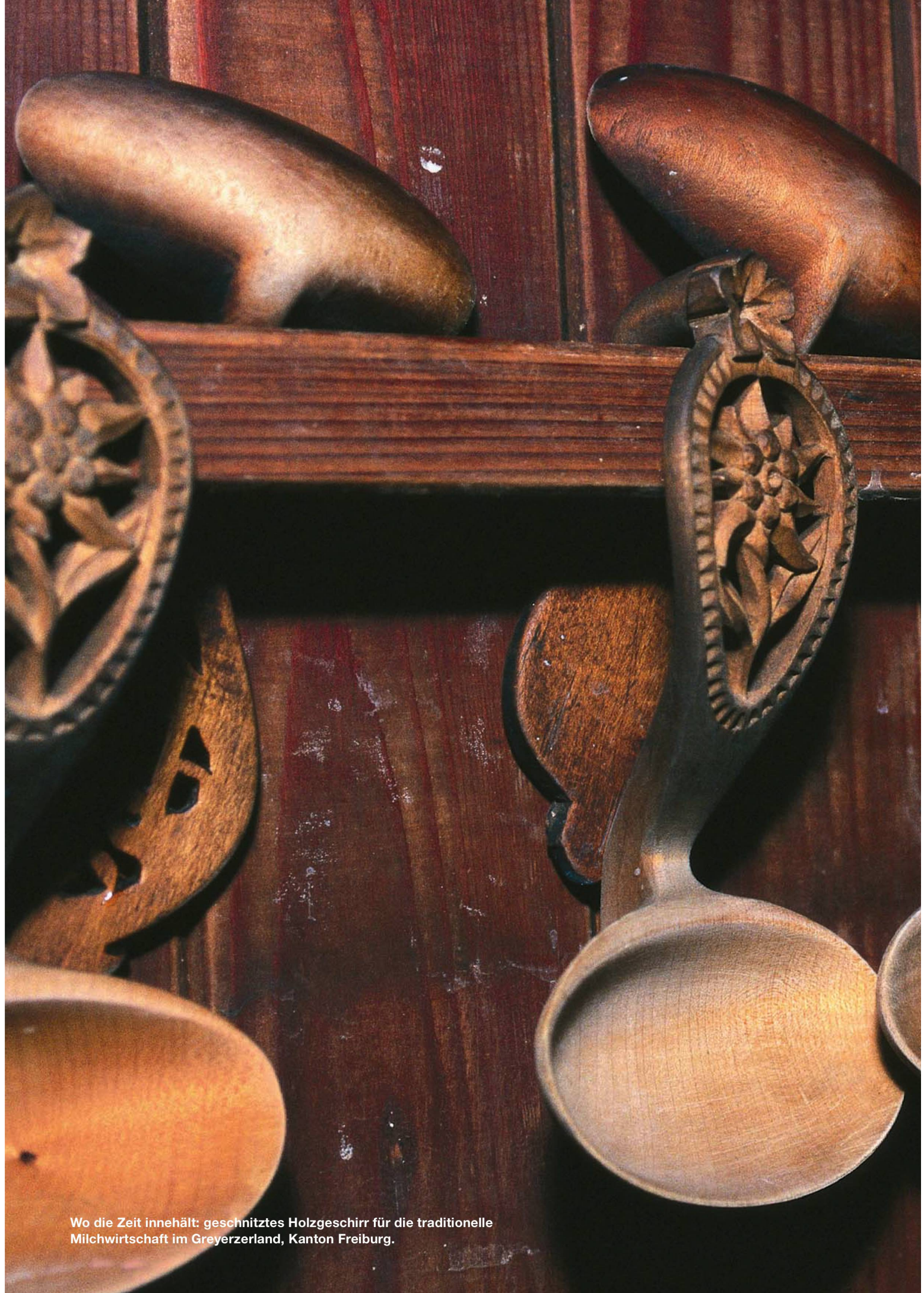
Wo die Zeit innehält: geschnitztes Holzgeschirr für die traditionelle Milchwirtschaft im Greyerzerland, Kanton Freiburg.