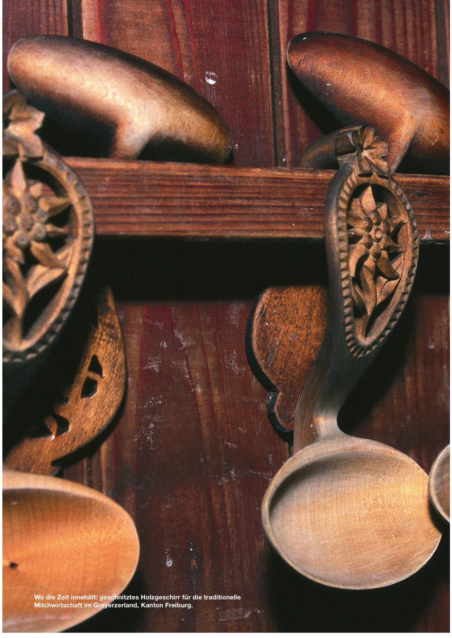
Wo die Zeit innehält: geschnitztes Holzgeschirr für die traditionelle Milchwirtschaft im Greyerzerland, Kanton Freiburg.