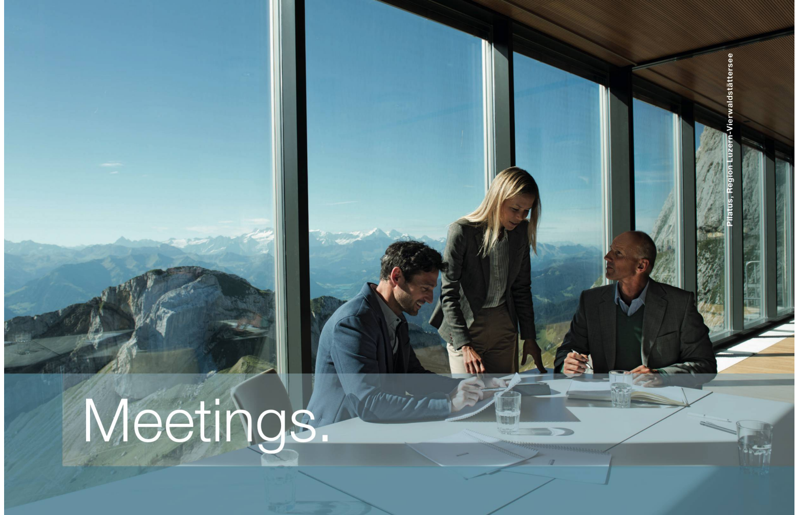
Pilatus, Region Luzern-Vierwaldstättersee