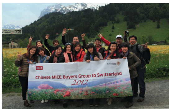
Die Teilnehmenden der Studienreise aus China bei ihrem Ausflug auf den Titlis.

Die ST-Abteilung SCIB baute die Marktpräsenz 2012 in den Städten Peking, Schanghai, Hongkong und Guangzhou aus. Dazu gehörten unter anderem Schulungen mit Incentive-Agenturen und anderen wichtigen Entscheidungsträgern. SCIB koordinierte hierzu eine Studienreise für zwölf Organisatoren von Incentive-Reisen nach Zürich, Luzern und auf den Titlis, aus der bereits erste Folgegeschäfte entstanden.