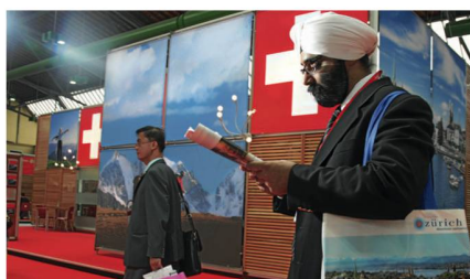
Am STM dabei: Einkäufer aus 45 Ländern. Le STM a attiré des acheteurs de 45 pays.

Organisé tous les deux ans par ST, le STM est le principal événement de promotion des ventes du tourisme suisse. C'est aussi une excellente plateforme de présentation pour la Suisse, destination de voyage, de vacances et de congrès. Les participants ont également l'occasion de visiter la Suisse avant et après le salon.