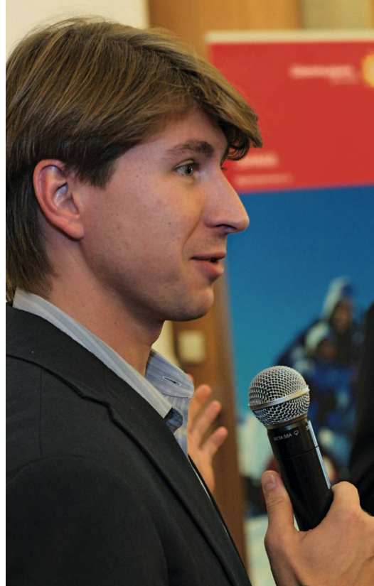
Schwärzte von der Schweiz: Alexei Yagudin. Un amoureux de la Suisse: Alexei Yagudin.