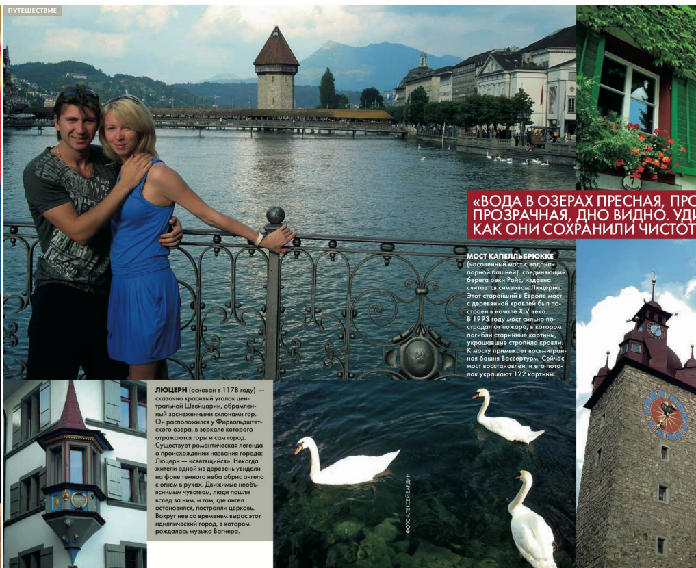
Das russische Hochglanz-Magazin LED präsentierte die Schweiz in einer sechseckigen Kür. Six pages de papier glacé sur la Suisse dans le magazine russe LED.