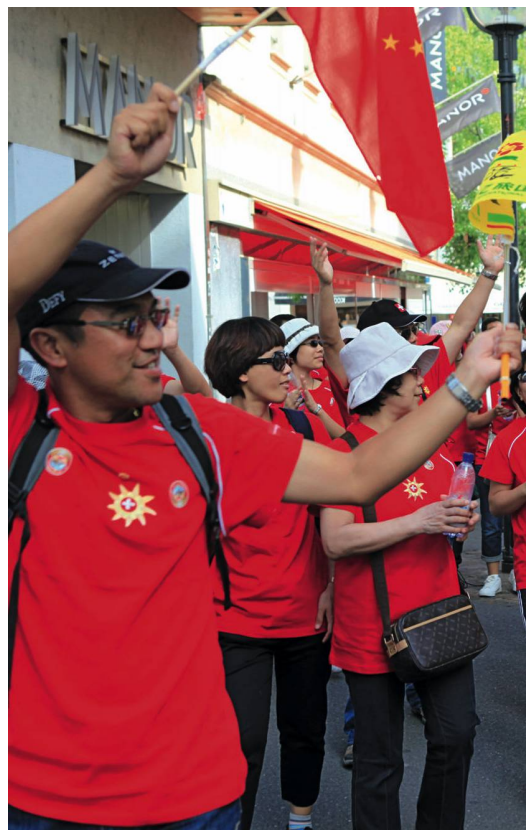
Begeisterte Journalisten in Lausanne. Journalistes enthousiastes à Lausanne.