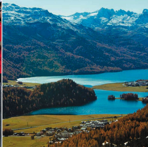
Zwölf Seiten Schweiz im chinesisches Magazin «Voyage». Dossier de douze pages dans le magazine chinois «Voyage».

直到坐上从苏黎世开往圣莫里茨的火车，车窗不断框出一幅幅田园风光图：雪山、草地、山间的翡翠湖泊，欧洲人家的蕾丝窗帘，藏着百年童话的小木屋，田野里叮当作响的牛铃……时差所带来的惬意和恍惚，一点点被阿尔卑斯山间特有的香草清风吹散。这时，才敢相信，我们真的到了瑞士。今年夏天，是我们一家三口的幸运季——作为瑞士旅游局“瑞士一家亲”活动唯一入选的北京家庭，我们赢得了为期十天的瑞士山地之旅。我们的行程打印出来足足有10页。朋友们称我们是“中瑞建交50年来最幸福的中国度假家庭”，而我们也期待着这一次的瑞士山地之旅，它会给我们全家带来怎样的一段旅程和体验？