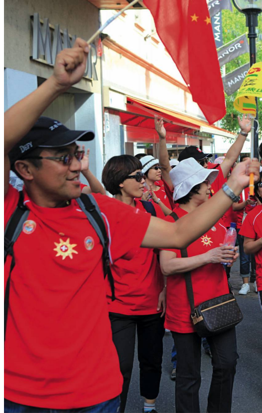
Begeisterte Journalisten in Lausanne. Journalistes enthousiastes à Lausanne.