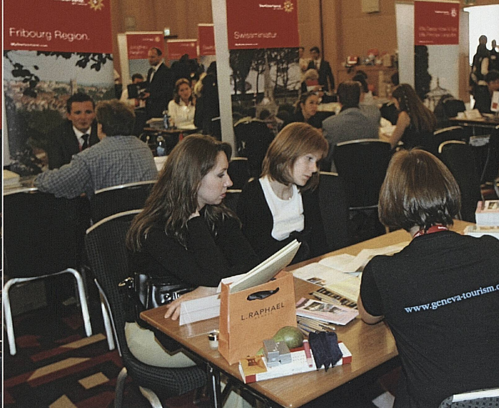
Der Schweizer Winter kommt in Russland gut an: 230 Reiseagenten und 72 Medienschaffende folgten der Einladung von ST zum Workshop in Moskau. L'hiver suisse a la cote en Russie: 230 agents de voyages et 72 journalistes ont répondu à l'invitation de ST et participé à un atelier à Moscou.