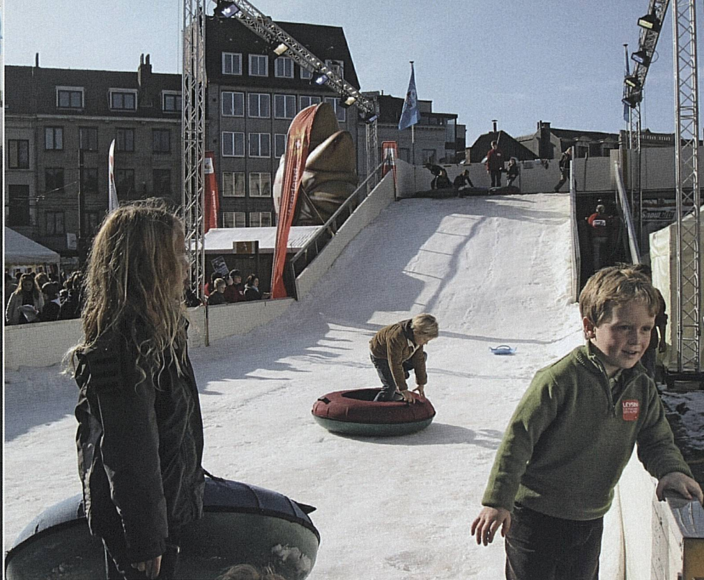
Gents Bürgermeister Tremont gefiel die Aktion ebenso wie den Kindern, die auf 40 Tonnen echtem Schnee erste Erfahrungen mit dem Schweizer Winter machten. Le maire de Gand Tremont a apprécié cette action tout comme les enfants qui ont fait leurs premières expériences de l'hiver suisse grâce à 40 tonnes de neige.