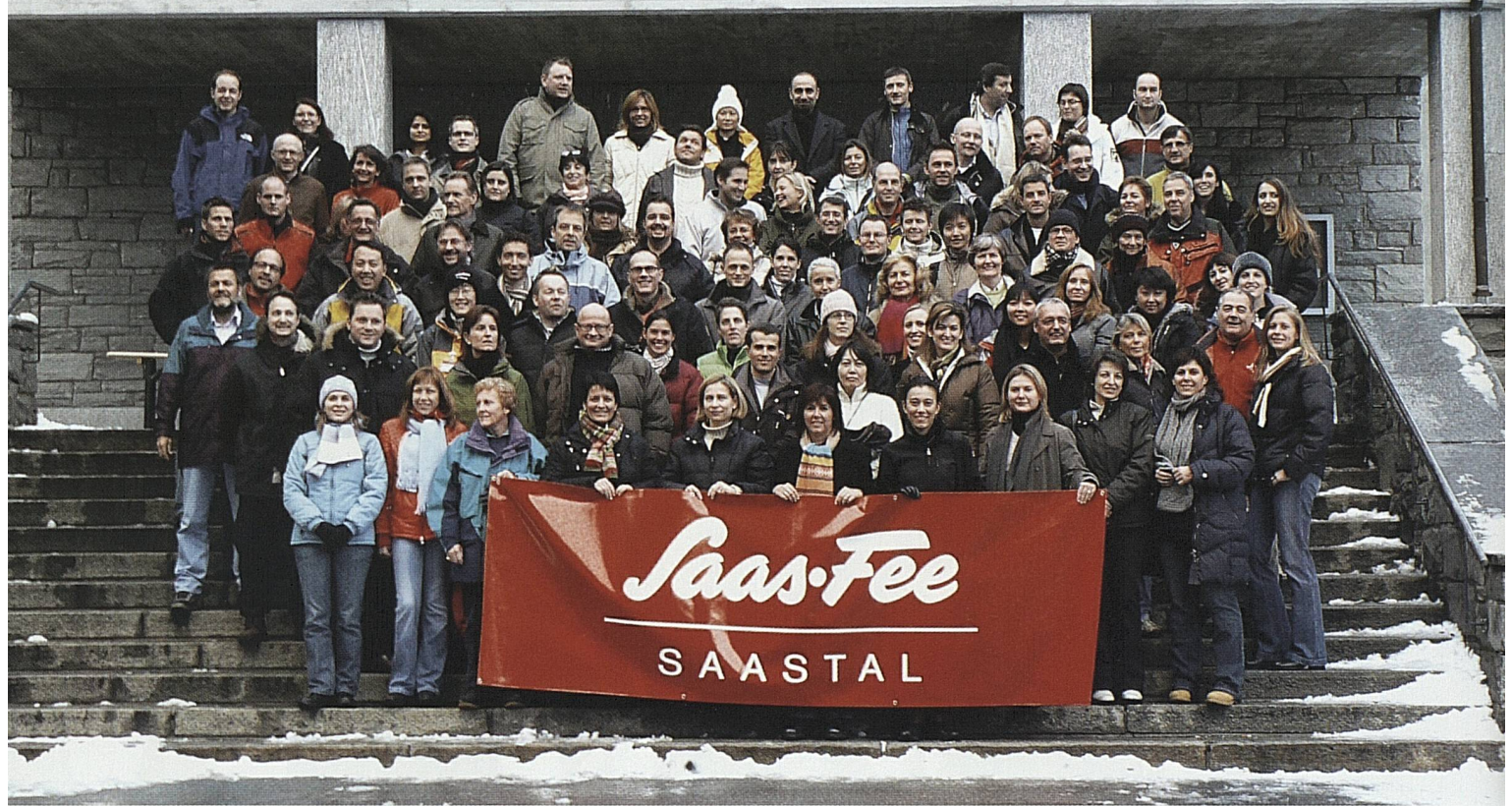
Die internationale ST-Crew trifft sich regelmässig für Workshops und strategische Seminare: dieses Mal in Saas-Fee. L'équipe internationale de ST se réunit régulièrement pour des ateliers et des séminaires stratégiques: cette fois-ci à Saas-Fee.