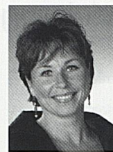
Aubert Isabelle (ab 1.1.2008) Direktorin Internationales Kongress- zentrum Genf (CICG)