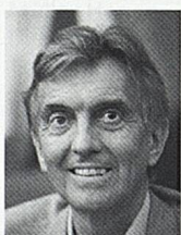
Solari Marco Präsident Ticino Turismo Präsident Internationales Film Festival Locarno