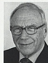
Robyr Jérémie Präsident Valais Tourisme