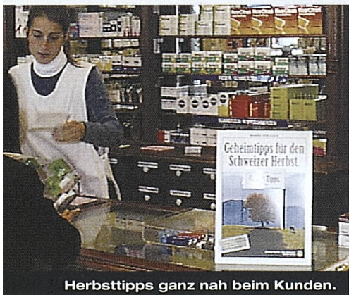
Herbsttipps ganz nah beim Kunden.

Das Jahr 2001 war von drei Kernkampagnen geprägt: Das Potenzial der Familien als Gäste sollte die Kampagne «Platz da für Kinder.» erschliessen. Der Aktivierung der in der Schweiz sehr attraktiven Herbstsaison war die Kampagne «Herbstlich Willkommen.» gewidmet. Um die sich abzeichnenden Verluste an Gästen aus den Überseemärkten durch europäische Gäste zu kompensieren, konzipierten wir schliesslich die gross angelegte Winterinitiative «Der wahre Reichtum der Schweiz.».