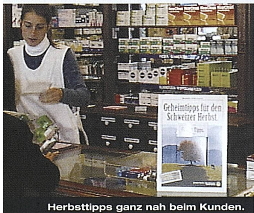
Herbsttipps ganz nah beim Kunden.

Das Jahr 2001 war von drei Kernkampagnen geprägt: Das Potenzial der Familien als Gäste sollte die Kampagne «Platz da für Kinder.» erschliessen. Der Aktivierung der in der Schweiz sehr attraktiven Herbstsaison war die Kampagne «Herbstlich Willkommen.» gewidmet. Um die sich abzeichnenden Verluste an Gästen aus den Überseemärkten durch europäische Gäste zu kompensieren, konzipierten wir schliesslich die gross angelegte Winterinitiative «Der wahre Reichtum der Schweiz.».