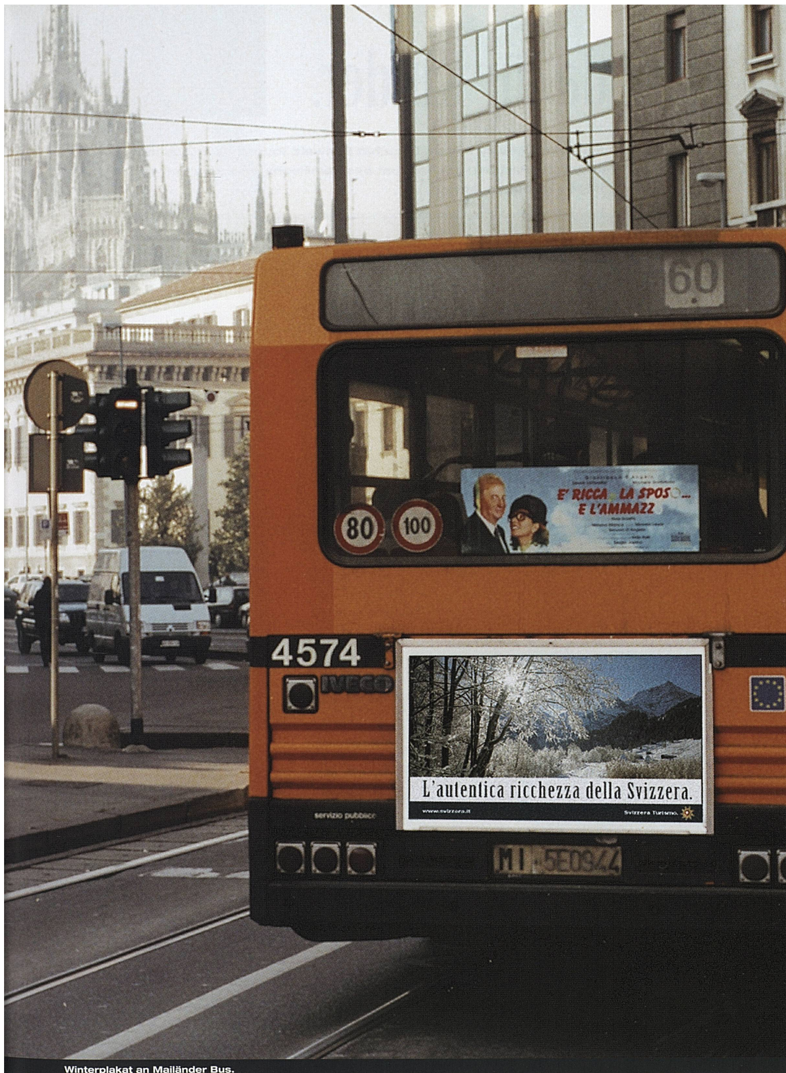
Winterplakat an Mailänder Bus.