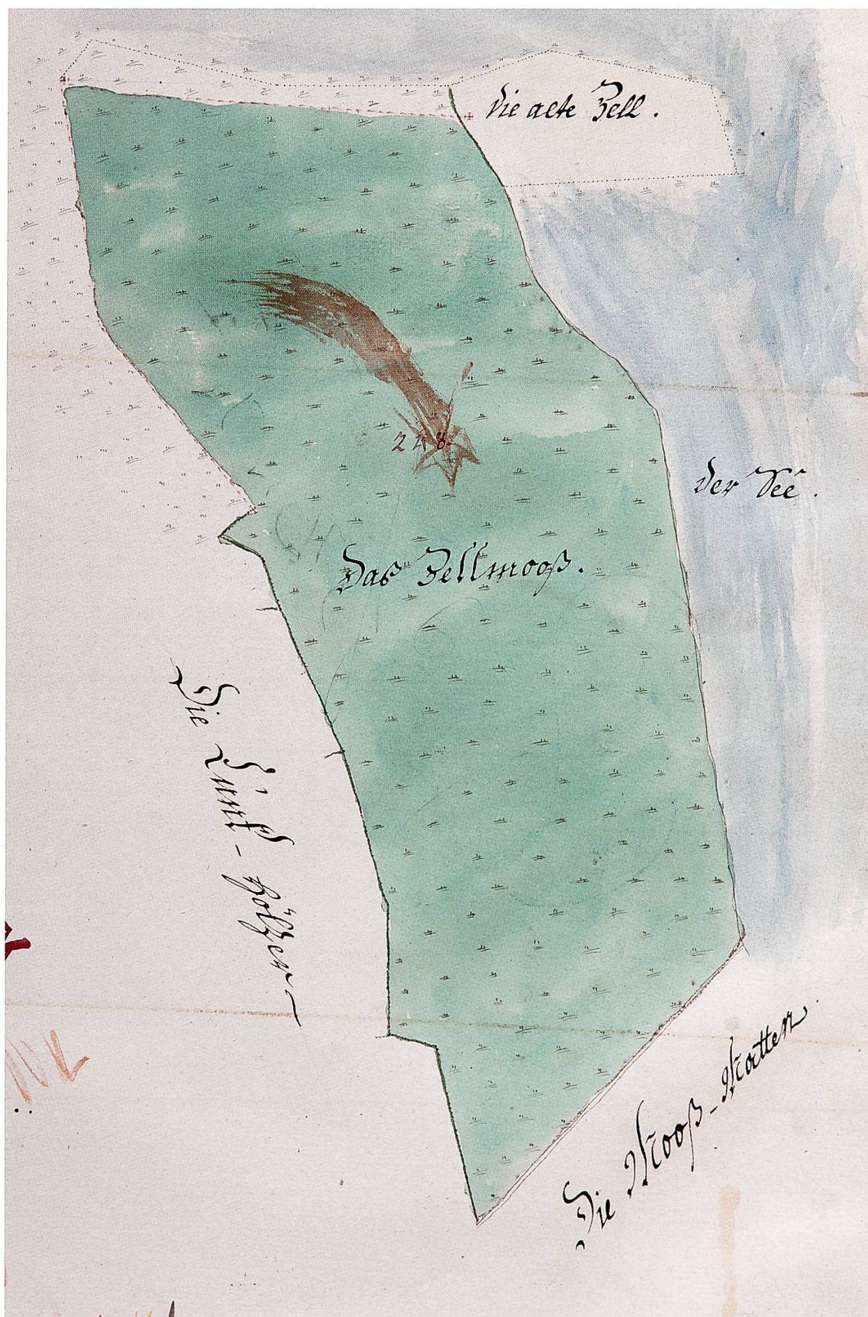
«Die alte Zell». Zehntenplan Sursee von 1784.