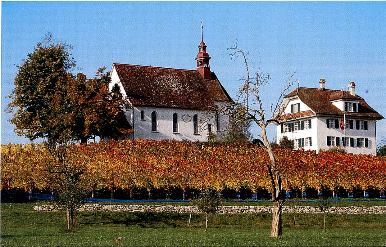
Wallfahrtskapelle Mariazell mit Kaplanenhaus und Rebberg. Aufnahme von 2008.

reformierten Nachbarschaft 458 , mit der Sursee einen lebendigen Austausch pflegte. Nicht von ungefähr nennt die Kirchengeschichte jene Zeit die Marianischen Jahrhunderte.