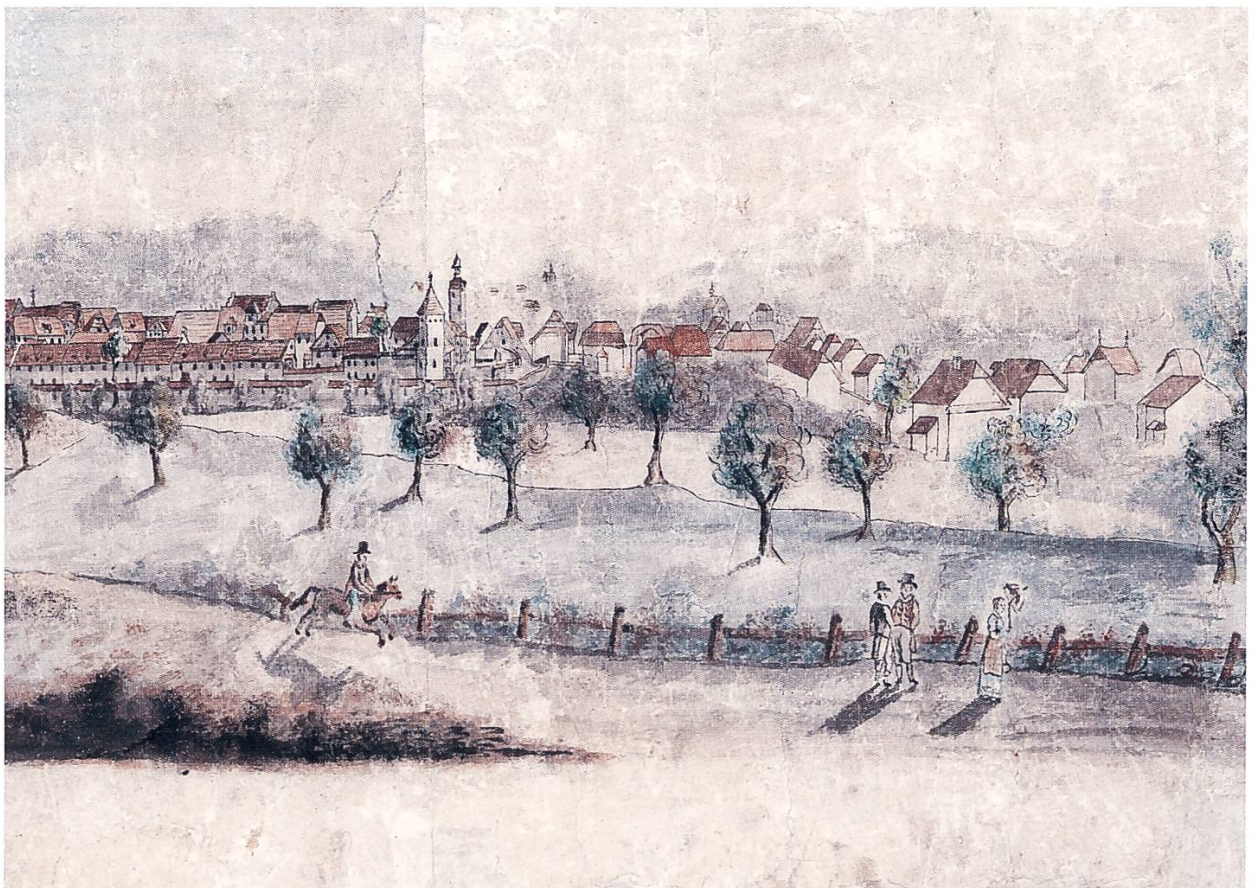
Die Vorstadt vor dem Obertor von Westen. Ausschnitt aus einer Stadtansicht um 1830. Feder in schwarzer Tusche, aquarelliert. Anonym.

Eine frühmittelalterliche bäuerliche Ausbausiedlung mit dem Namen Wile entwickelte sich im oberen Surental beim südlichen Ausläufer der Moräne unweit deren höchstem Punkt um den vorstädtischen lokalen Herrenhof und Herrschaftsmittelpunkt von Sursee. Dabei gelangten mit der Zeit Güter im Gebiet um Sursee in den Besitz mehrerer Klöster. Als diese aber nach dem Vorbild des Adels von der eigen-