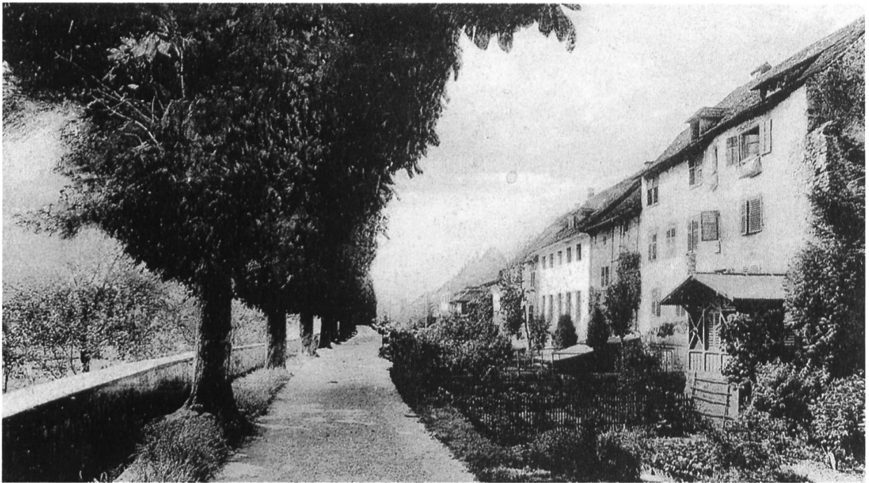
Blick vom Murihof in den Oberen Graben um 1905: Schon vor der Aufschüttung der Grabenfläche 1909 ist der Grünstreifen als Pflanzfläche benutzt worden. In den 1830er und 1840er Jahren standen hier die Maulbeerbäume für die Seidenraupenzucht.

abholzen zu dürfen. Ganz ohne Skepsis war die Behörde also nicht. Daraufhin weist auch die Ablehnung eines weiteren Gesuches um Pflanzflächen im Oktober 1843. 76