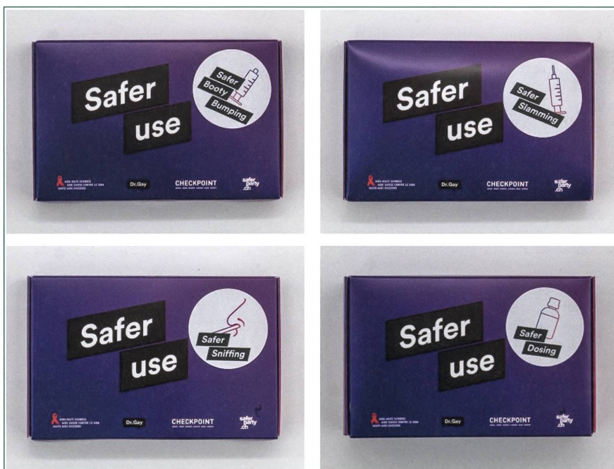
Abbildung 1: Bestellbare Safer Use Kits. 5 https://tinyurl.com/ytu86jbp

Bisher wurde der Thematik Sexualität in Beratung und Therapie keinen grossen Stellenwert beigemessen, da die meisten Fachpersonen aus der Medizin, Psychologie oder der Suchtarbeit kommen. Die Gruppe der Sexolog:innen ist kaum vertreten. Aus sexologischer Sicht ist es unabdingbar diese Beratungslücke